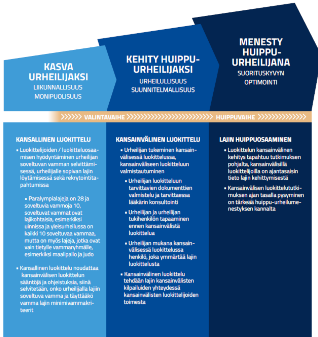
Kuvio 18. Paraluokittelu urheilijan polun eri vaiheissa.