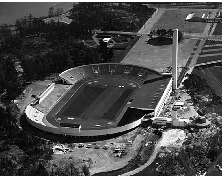
Stadion vuonna 1938.

Helsingin stadionista tuli jo alkuperäisessä muodossaan suurempi kuin Tukholmaan 1912 valmistunut. Tukholman stadionin piirtänyt Torben Grut olisi tosin halunnut rakennuttaa paljon mahtavamman urheiluareenan,