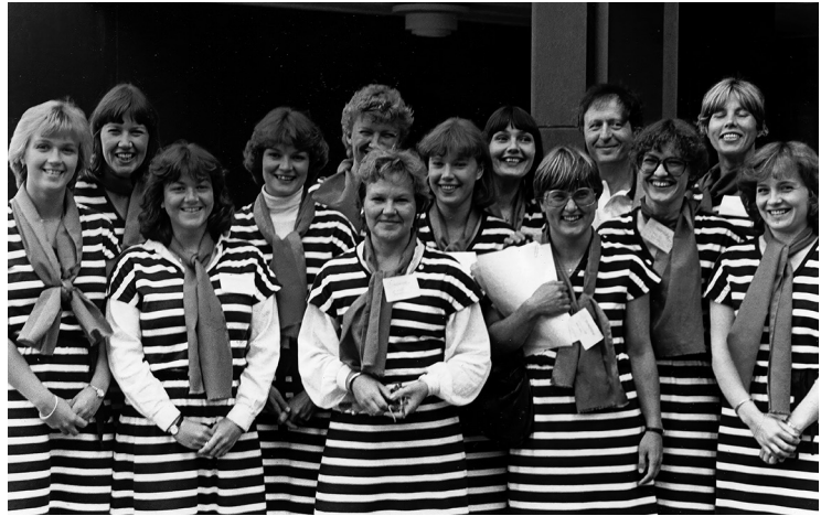
Hyvä tapahtuma tarvitsee osaavia tekijöitä. LTS:n väkeä Sport and International Understanding -konferenssissa.

Vuonna 1988 valmistui yhteistyössä Delta-videon kanssa tuotettu 16-minuuttinen Kevyesti keski-iässä -video. Sen tavoitteena oli saa-