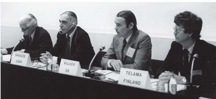
Urheilun Etyk järjestettiin heinäkuussa 1982.