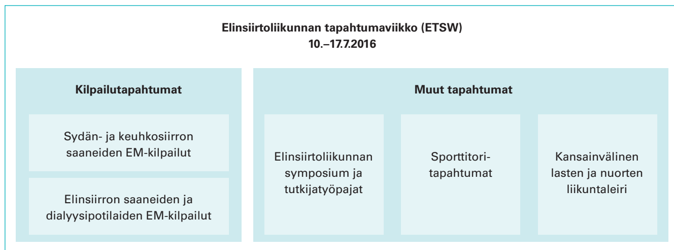
Kuvio 1. ETSW:n tapahtumat.

Tutkimusaineisto kerättiin Webropol-kyselyllä, jonka ETSW:n vapaaehtoisten koordinaattori lähetti kaikille 182 tapahtumaa jär-